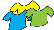
tres camisetas (3枚のTシャツ)