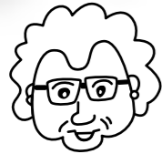
Mi abuela (私の祖母)